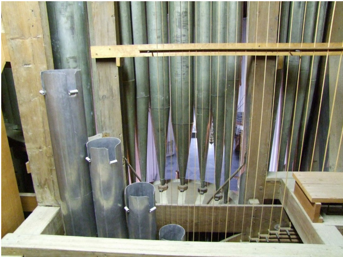
'Achter de Pijpen van het Orgel'