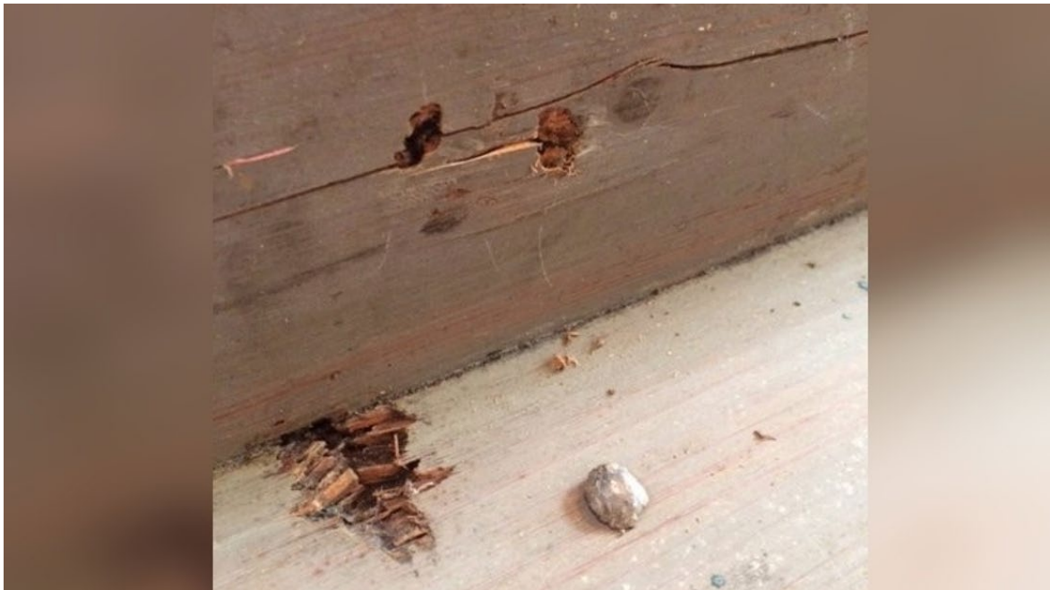
De kogelgaten in de blaasbalg