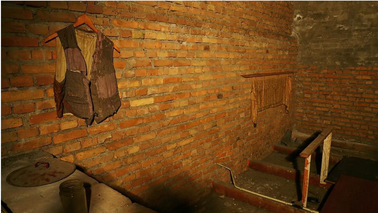
De zolder achter het orgel van de Breepleinkerk

Na de bevrijding zijn de onderduikers 'zo de deur uitgelopen' en nooit meer teruggekeerd. Pas in 2006 werden de orgelzolders, waar de onderduikers zich 34 maanden verstopt hadden, herontdekt. Er lagen nog spullen van de echtparen, die al die tijd daar hebben gelegen. Dozen matses, maar ook snoeppapiertjes, lucifers, kledingstukken, een blikje met kooltjes en een klein gebroken lampje lagen nog onaangeroerd op de houten vloer. (1)