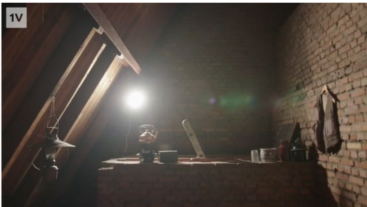
Filmstill uit documentaire EenVandaag, 4 mei 2020