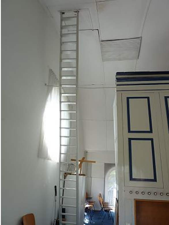
De kerk van Bierum. Rechts het orgel, linksboven het luik (foto J. Bultena, 2015)