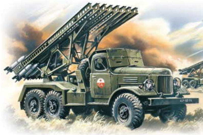
Een illustratie van een stalinorgel (uit: 'Rusland in woord en beeld')

Deze werden overigens al tijdens de Tweede Wereldoorlog door de Russen gebruikt. Deze Katjoesjaraket kreeg van de Duitse soldaten vanwege het geluid van de raketten, de orgelachtige vorm (de pijpen om de raketten af te schieten staan parallel, net als bij orgelpijpen) en omdat Jozef Stalin destijds de leider van de Sovjet-Unie was, al snel de bijnaam stalinorgel. 40