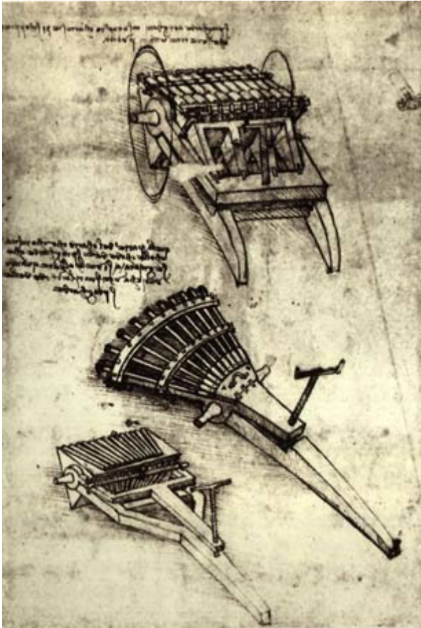
Een orgelkanon getekend door Leonardo da Vinci (1452-1519)

In het laer-dicht op de verlossing der Stads Deventer wt het geweld der Spanjaerden uit 'Over-Ysselsche sangen en dichten' (1630) van Jacobus Revius 36 verwijzen de 'orgel-fluyten' (r.181-182) naar het geschut, waar op één affuit verschillende lopen verenigd waren: