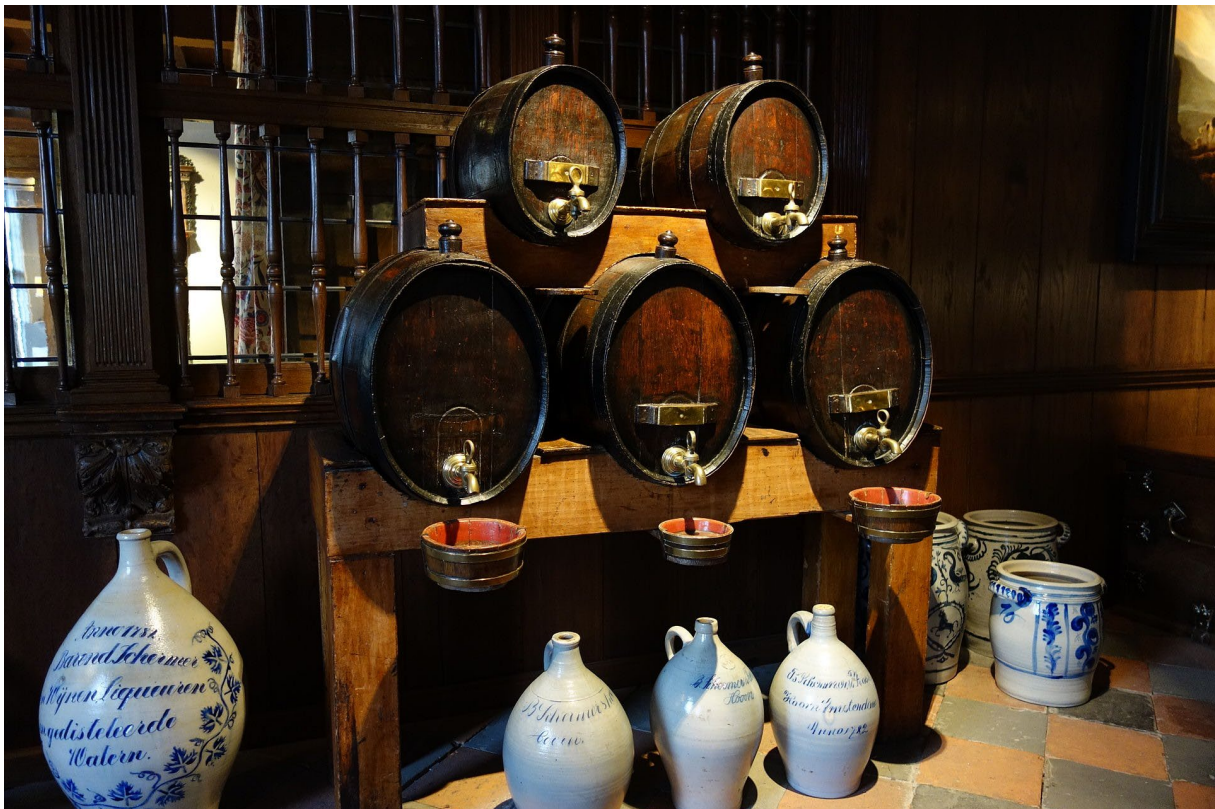
Een drankorgel

Al eind 19 e eeuw werd 'drankorgel' synoniem voor alcoholist. 38