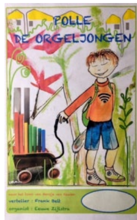
Affiche voor de première in 2017