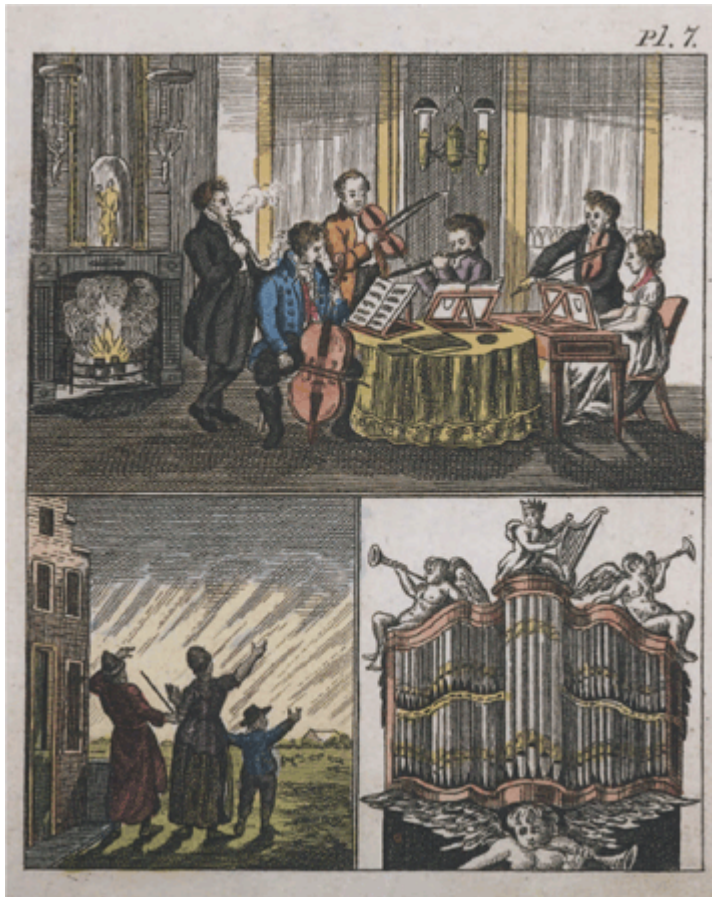
'De muziek', 'Het noorderlicht' en 'Het orgel' uit: 'Leerzaam Mengelwerk voor de Jeugd', tweede druk, Leyden, P.H. Trap, 1820

Met name bij kinder- en jeugdboeken speelt het draaiorgel een grotere rol dan het (kerk)orgel. 1 Gelukkig heb ik toch nog wat boeken gevonden waarin het orgel en de organist een plekje kregen, deels uit degelijk christelijke hoek. Veel beschrijvingen vonden we terug in het Centraal Bestand Kinderboeken van de Koninklijke Bibliotheek. In sommige boeken zit wellicht een mooi educatief verhaal, dat geschikt te maken is voor deze tijd.