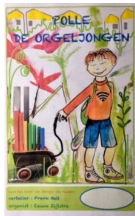
Affiche voor de première in 2017